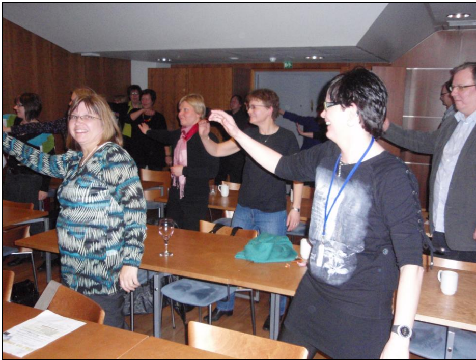
OAJ on Stage, Kokkola